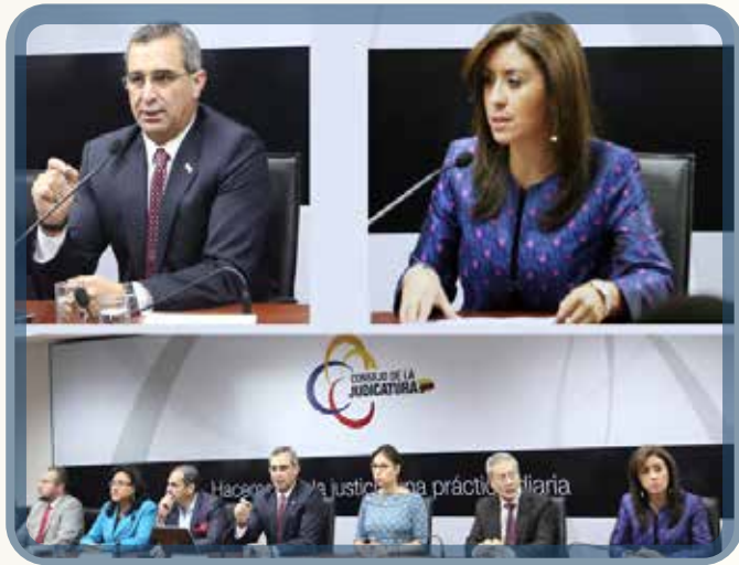
Rueda de prensa - Consejo de la judicatura

El concurso está dividido en 3 fases: méritos, oposición y prueba psicológica.